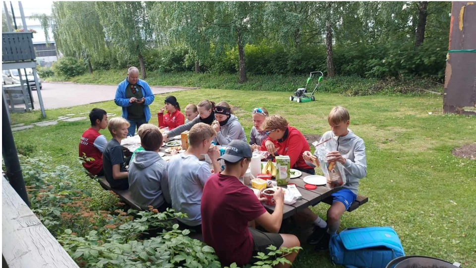
Lunsjbilde sommeris