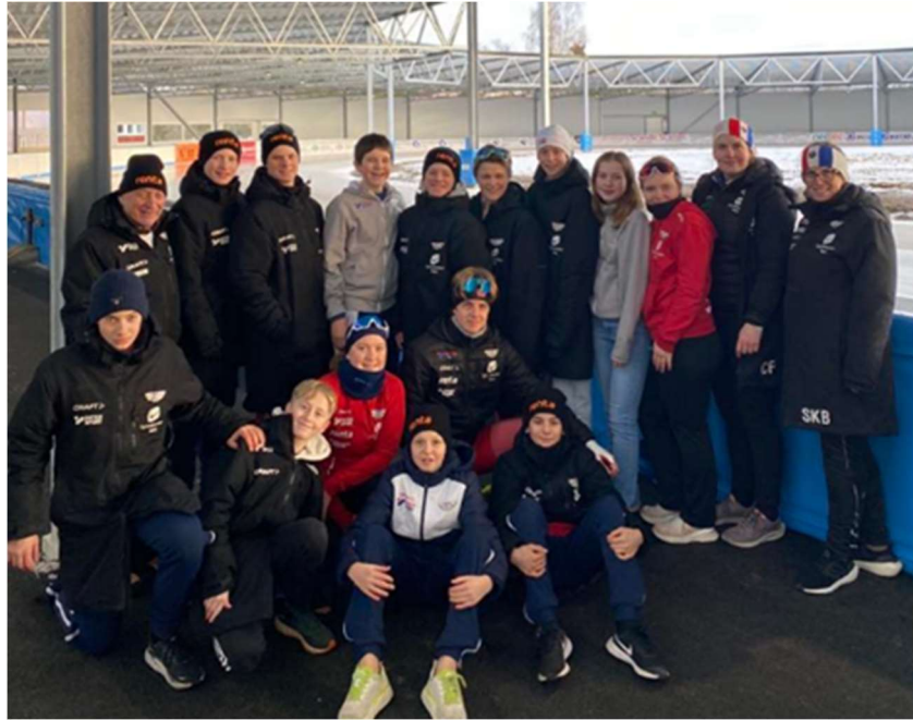
LM Båstad