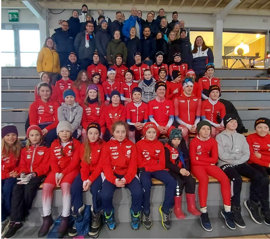
Lagbilde fra Rekordløpet