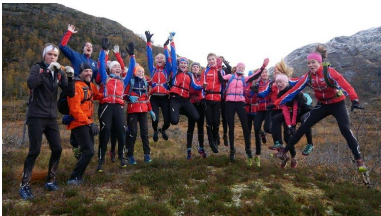
Spennstrenning for 15+ gruppen på høstsamling i Stølsheimen.