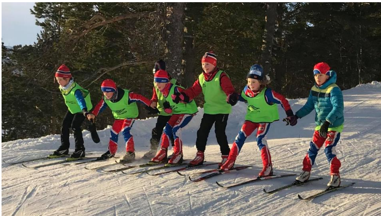
Skimestring i gruppe 7-10 år - frå Geilosamlinga

Flere av barna i gruppen har også deltatt aktivt på ulike skirenn gjennom vinteren og har hatt en fin utvikling i både klassisk- og skøyteteknikk. Spesielt gledelig med stor deltagelse på både Parkstafetten og Ørnarstafetten (7 lag).