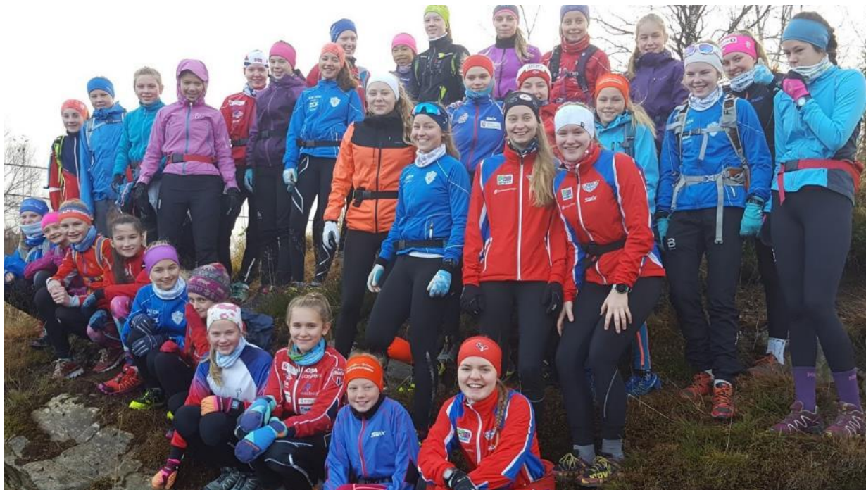
Frå jentesamlinga på Fanahytten.

Det har vore fokus på å redusera fråfallet som ofte slår inn frå 14-årsalderen, spesielt blant jentene, og eit tiltak, gjennomført sidan 2012, er den populære jentesamlinga på Fanahytten for langrennsjenter i alderen 13 år og eldre for alle klubbane i kretsen. I år deltok 32 jenter på samlinga som går i regi av Fana.