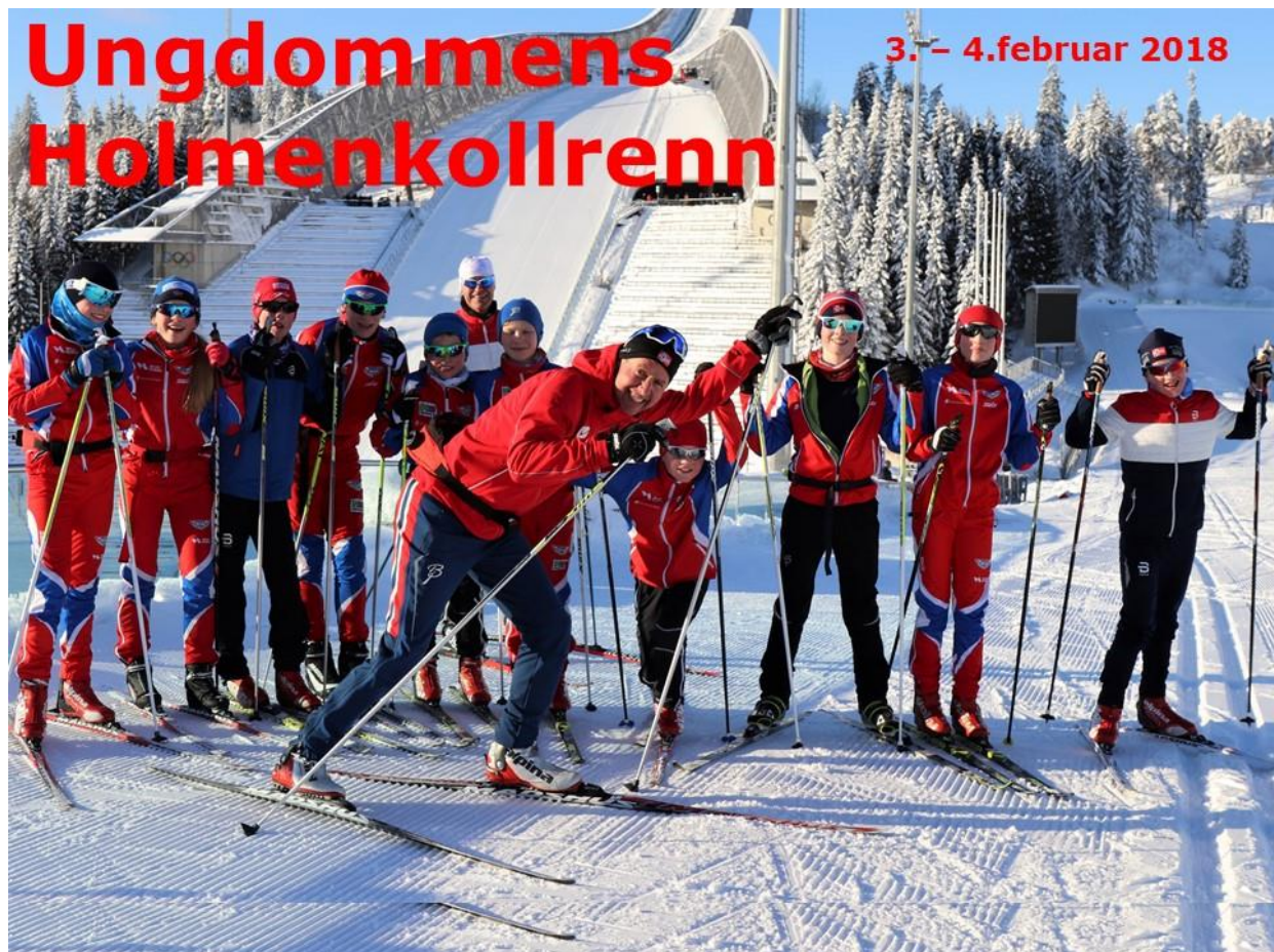
Ungdommens Holmenkollrenn – eit populært høgdepunkt og viktig treningsmål for 13- og 14-åringane.

Som tidlegare har vi lagt vekt på balanse- og teknisk trening med trening på rulleski torsdagar i heile barmarkssesongen, der vi også i haust har brukt området ved Sandslihaugen 30 (gamle Statoil-bygget). Rulleskitreninga har gjort terskelen litt lågare når det gjeld å hiva seg med i konkurransar med litt spinkel skitrening. Løpsbasert distanse/intervalltrening på barmark er lagt til tirsdagane. Vi har sett god framgang hjå utøvarane, og det er kjekt at mange driv eigentrening. Utøvarane har hatt fleire overnattingsturar; Bømosamling på Voss (kretsen), ei fin haustsamling på Lid i Bergsdalen i oktober i tillegg til den klassiske Geilosamlinga. Jentene i klassane 13-14 år har også deltatt på jentesamling på Fanahytten saman med jenter frå andre skiklubbar i kretsen. To av utøvarane i gruppa driv med skiskyting og er i tillegg med på samlingar der. I tillegg har mange delteke på sommarskiskular, til dømes på Folgefonna i juni og på Beitostølen i august.